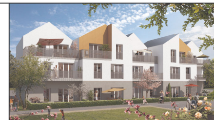
BATIMENT A T2 N°5 ETAGE R+1